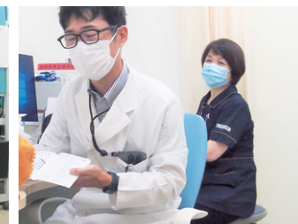
診察室では、医師の隣でカルテ入力などを補助。