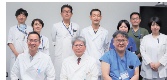
痛みセンターのスタッフ 多診療科・多職種で患者さんの“痛み”と向き合います

手術療法、ブロック注射、リハビリテーション療法などもあり、難治性の痛みにはこういった様々な治療法を組み合わせる多角的鎮痛法が有効と言われています。本センターでは、医師・歯科医師や、看護師、薬剤師、臨床心理士、理学療法士、医療ソーシャルワーカーなどの多職種が連携して、患者さん一人一人にあった治療・サポートを行います。