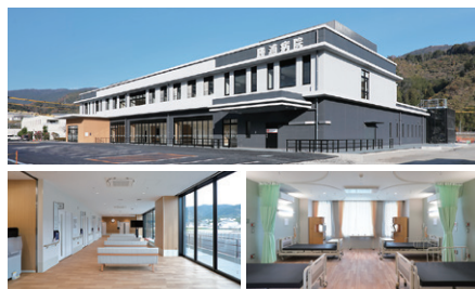
新しくなった勝浦病院。明るい外来待合と病室の様子