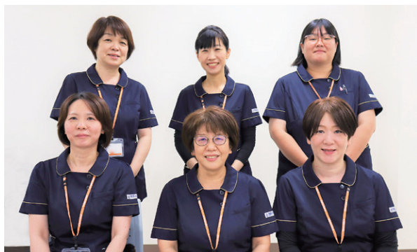
私たちはメディカルクラーク(医師事務作業補助者)です。

徳島大学病院では医師や看護師のほか、様々な職種のスタッフが勤務しています。その中でも医師事務作業補助者という職種については、まだご存じではない方も多いのではないのでしょうか。