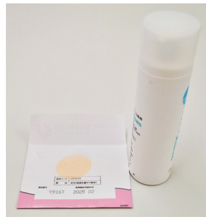
ホルモン補充療法で用いる 貼り薬とジェル状塗り薬

更年期障害の治療は、減少する女性ホルモンを補うホルモン補充療法(HRT)や漢方療法、症状への対処療法(抗不安薬・睡眠薬の服薬など)のほか、カウンセリングや生活習慣(睡眠・食事・運動)の改善などがあります。ホットフラッシュに代表される血管運動神経症