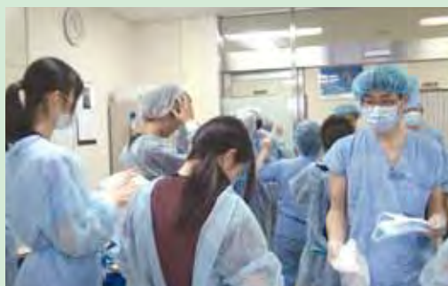
恒例の病院見学で手術部を見学する高校生たち。

地域医療推進学講座では、医師を目指す山口県内の高校生を対象に、実際の医療現場の見学と体験、医学生や医療従事者との対話と交流を通じて、「医師の仕事や医療を理解し、医師になる意欲を育む」ことを目的に医療現場体験セミナーを毎年実施し、今年で4年目になります。これまで、岩国、防府、徳山、萩、長門、下関など山口県内一円の地域で開催しています。