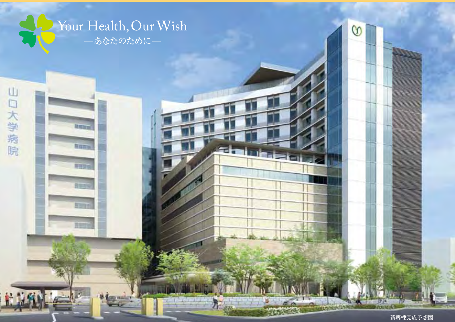
新病棟完成予想図