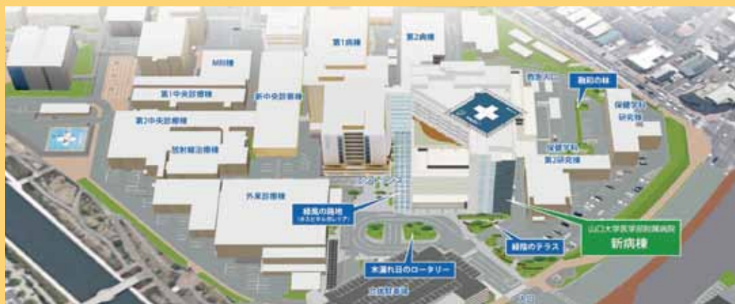
新病棟完成位置図