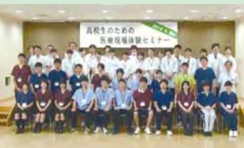
今年はずでに山口県立総合医療センターと徳山中央病院で実施。写真は、7月21日徳山中央病院にて。