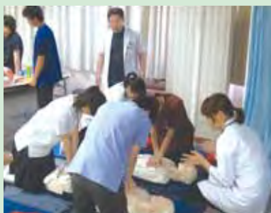
心肺蘇生の実習。現場の医師と学生が一緒になってインストラクターを務めました。

今年はずでに、7月20日に山口県立総合医療センター、21日に徳山中央病院で実施し、2日間で総勢55名の現役高校生の参加がありました。さらに、10月26日には秋市民病院でもセミナーを開催する予定です。本セミナーを通して、地域医療に対する関心が少しでも高まることを期待しています。