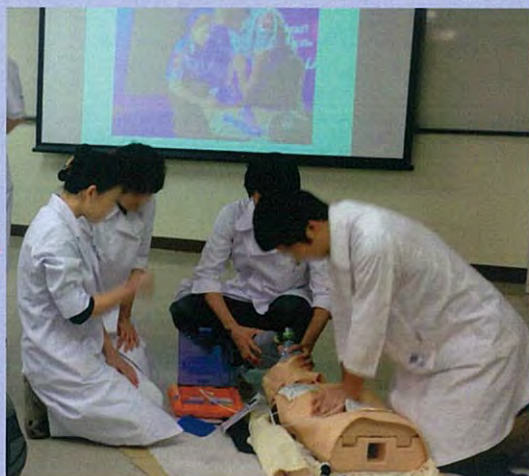
次にチームで (自動体外式除細動器 (AED) を用いて)