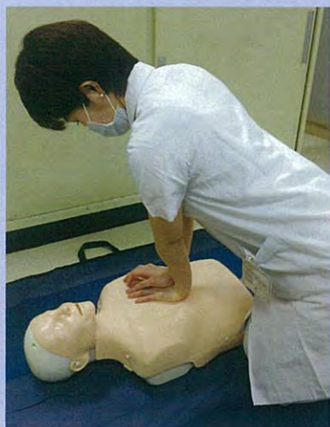
まずは一人で (胸骨圧迫)