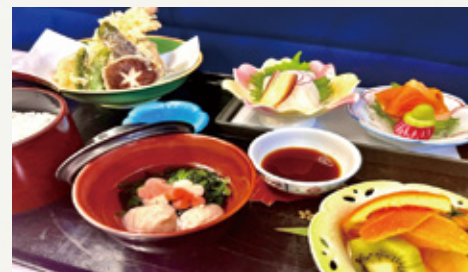
選択メニュー (一例)

訪問、ミールラウンドなどを随時行い、患者さんの入院環境の整備に努めております。今年度は、管理栄養士の病棟配置も開始し、入院診療の更なるサポートを目指します。