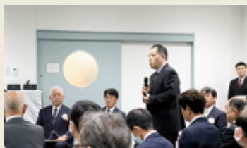
森口初期救急医療センター長