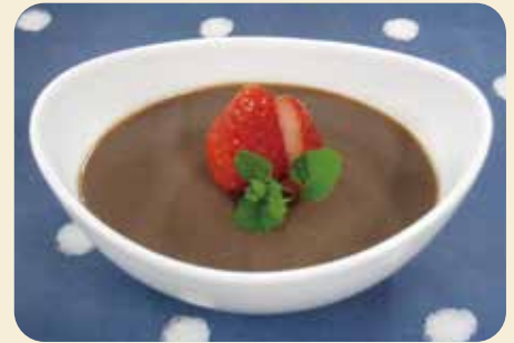
※写真の器は8×10cm、盛り付けは1人分です。

甘酸っぱいイチゴと一緒に口の中へ入れると、とっても美味しい♪ 手軽に作れるので、ぜひお試しください。