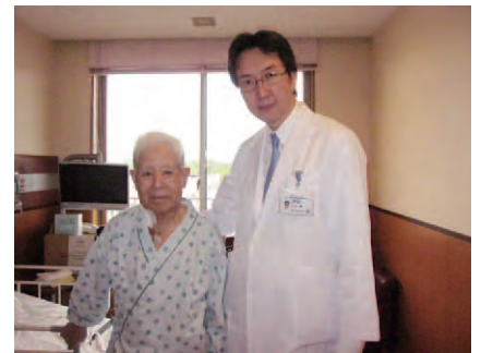
弓部大動脈全置換術の翌日に病棟で歩行している85歳の患者様。最高難易度の手術でも超早期回復でお応えします。

また、より低侵襲な手術としてステントグラフト挿入術があります。これは通常の手術のように開腹や開胸をせずに、カテーテルで内側から瘤をなおす治療です。当院でも2009年からステントグラフト治療を開始し、症例を積み重ね、胸部でも腹部でも、最重症例に自信を持って対応できるようになっています。