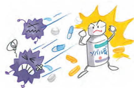
C型肝炎治療のガイドライン（1型と2型では治療が大きく違います）

ざまな副作用が出現するインターフェロンに比べて、副作用が少ないことから、入院の必要がなく、外来で投与ができることも大きな特徴です。