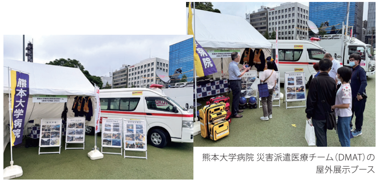
熊本大学病院 災害派遣医療チーム(DMAT)の屋外展示ブース