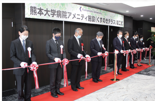
12月2日、竣工式典でテープカットが執り行われました

建物内にはコンビニエンスストア、レストラン、ベーカリーショップなどのアメニティスペースに加え、