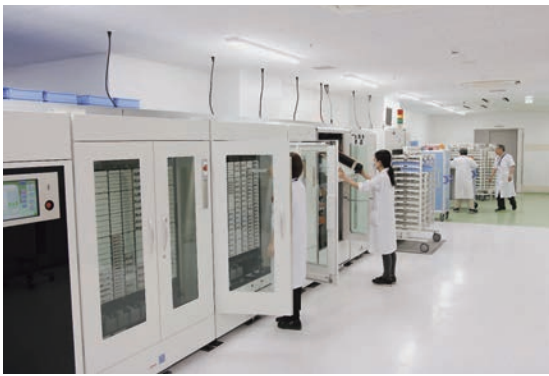
▲薬剤部内部の様子

平成29年5月、病院再整備計画に基づき薬剤部は移転となりました。移転するにあたり、調剤や調製など、従来の薬剤師業務を高度に自動化した「インテリジェント薬剤部」構想を立案しました。