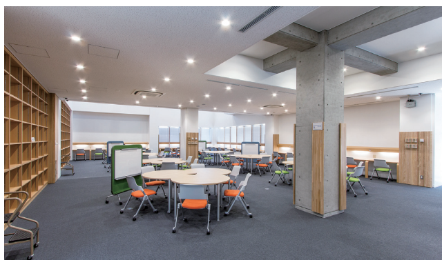
ディスカッションスペース