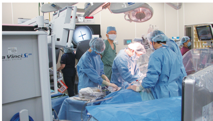
初症例は外部からプロクター（指導者）を招請

前立腺手術に加え、腎部分切除術を開始したことにより、H29年1月以降ロボット手術予定の患者さまが、急激に増加してきました。待機時間が長くなるに