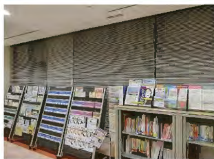
■がん冊子・書籍等の情報コーナー