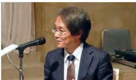
座長:今野地域医療連携福祉センター長