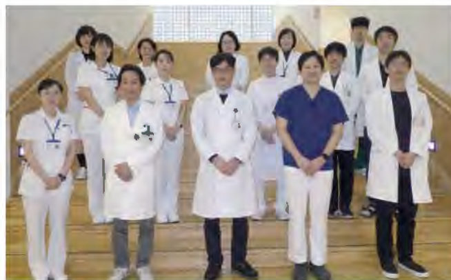
HIV診療支援センター/HIV相談室スタッフ

HIV相談室には、医師、看護師、ソーシャルワーカー、カウンセラー、情報担当、事務員などのスタッフがおり、各職種が連携して HIV感染症に関する様々な活動を行っています。相談業務としては、通院中の患者さんだけでなく、他の医療機関からの相談窓口としてもご利用いただいております。また、歯科、透析施設、福祉サービス事業所の各ネットワークを構築しており、HIV感染症患者さんのニーズに迅速に対応できる体制を整えています。さらに要請のあった医療機関・福祉サービス事業所等に対して HIV出張研修を実施しており、毎年多数のご施設より申込みをいただいております。また、北海道 HIV/AIDS情報というウェブサイトを作成し、一般の方・医療者向けに基礎知識や最新情報の提供も行っております ( http://hok-hiv.com/ )。