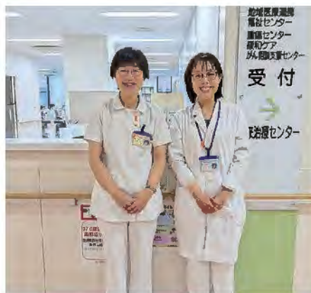
■相談員（がん看護専門看護師・医療ソーシャルワーカー）