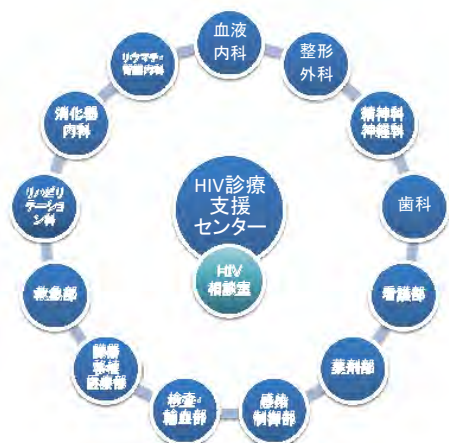
図1. HIV診療支援センターの構成

近年、患者さんの生命予後の改善により、様々な合併症に対する包括的な診療・支援が必要となってきたことから、2016年7月に HIV診療支援センターが設置されました。当センターでは、HIV相談室が中心となり院内の関連部署と連携して HIV感染症に関する診療支援を行っています。