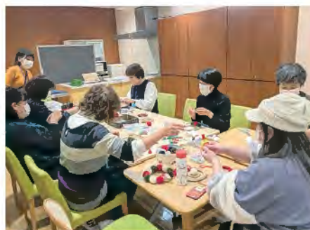
■サロン「なないろ」の様子