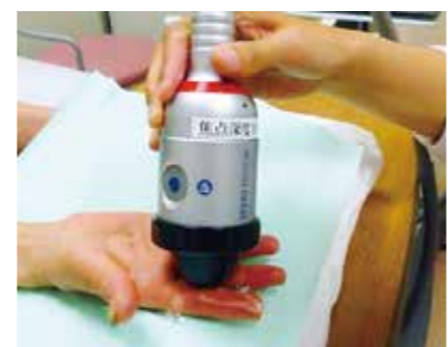
写真1 膠原病における難治性皮膚潰瘍に対する体外衝撃波療法

現在、年間乳がんの罹患者は約6万名を超え、約1万2千名が死亡しています。つまり、乳腺外来に患者が毎年約4万8千名ずつ増加していることとなります。乳がん患者に特徴的な問題として、50歳前後が好発年齢のためライフサイクルの上で役割が大きい、20歳代～40歳代では、結婚や妊娠・出産への不安が大きい、治療方法の選択肢があり、患者の意思決定が求められる、治療によるボディイメージの変化、セクシュアリティへの影響等があげられます。乳がんは、他のがんに比べて治療期間が長く、初発治療後10年以上の長期に渡って経過をみていくため、再発・転移への不安が続きます。このような複雑な問題を抱える患者に対して、専門的な支援を提供できる看護師が必要だと、2003年に乳がん看護が分野特定され、2005年に千葉大学で教育が開始されました。私は、2007年に乳がん看護認定看護師資格