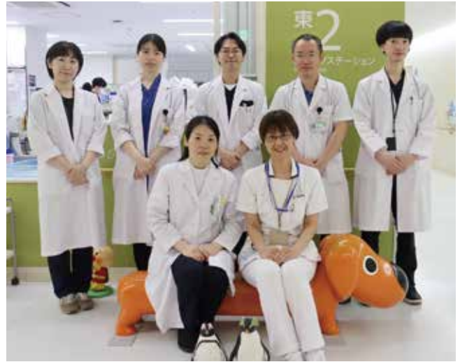
小児外科スタッフ

小児外科はあまり聞き慣れないかもしれませんが、こどもの手術をする診療科で、首からおしりまで色々な病気を扱っています。生まれてすぐの小さな赤ちゃんから、成長して成人した患者さんの治療にもあたっています。小児科・総合周産期母子医療センターと連携してチーム医療を実践しており、急患にも対応しています。香川県のこども