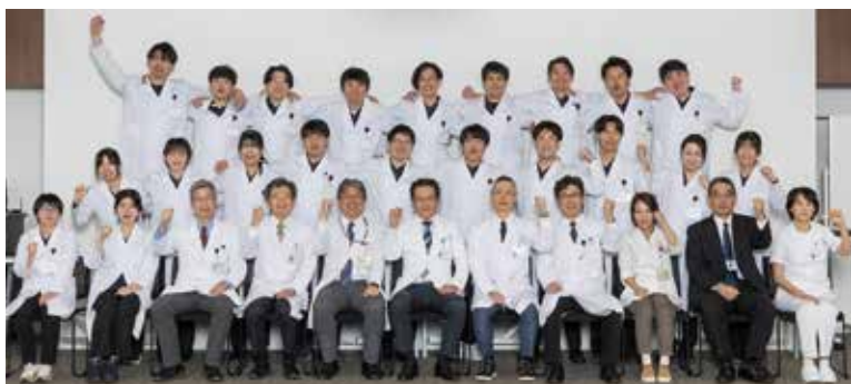
集合写真：令和8年度採用新研修医 2026年3月30日撮影

現代の社会ニーズを踏まえ、地域社会に必要とされる医師の育成に引き続き取り組んでまいります。つきま