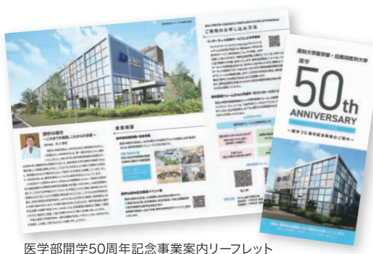
医学部開学50周年記念事業案内リーフレット