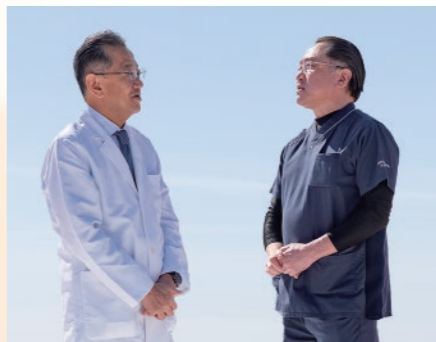
救急救命士と語らう

本院は高知県唯一の大学病院であり、高度先進医療の最後の砦としての役割を担ってきました。ひき続き高度急性期医療や先進的医療の提供を行うにつれ、医師会の先生方や地域の医療機関との連携を深め、県全体の医療水準の向上および日本一の健康長寿県構想に貢献することが、重要な使命であると考えます。