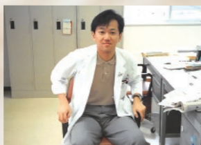
須崎くろしお病院にて(医師3年目)