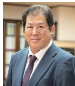
医学部長／泌尿器科 教授