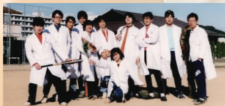
高知医科大学時代 ポリクリ終了後(右から3人目)

日本内科学会総合専門医、日本循環器学会専門医、CVIT認定医、高血圧専門医、日本老年病専門医