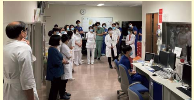
造影剤急性副作用シュミレーション実施時(MRI室です)

CT や MRI などの画像検査や IVR と呼ばれる画像ガイド下治療、さらに放射線治療を実施する中央部門です。所属する診療放射線技師は55名、画像診断を主に担う画像診療部には後期研修医などを含め24名の放射線科医が所属していますが、そのほかさまざまな診療科・職種のスタッフが入り出しています。先進的な IT 技術に溢れていますが、放射線被ばく管理や造影剤の安全使用など、部門特有の医療安全管理も必要で、特に気を使っています。