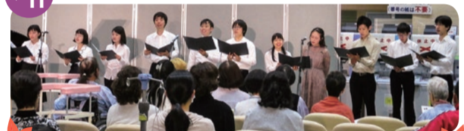
大阪大学医学部合奏団による演奏の様子